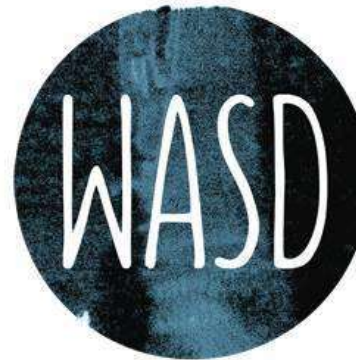
WASD Media GmbH